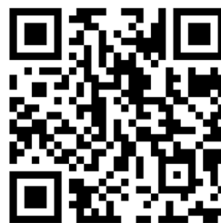
經濟研究期刊首頁